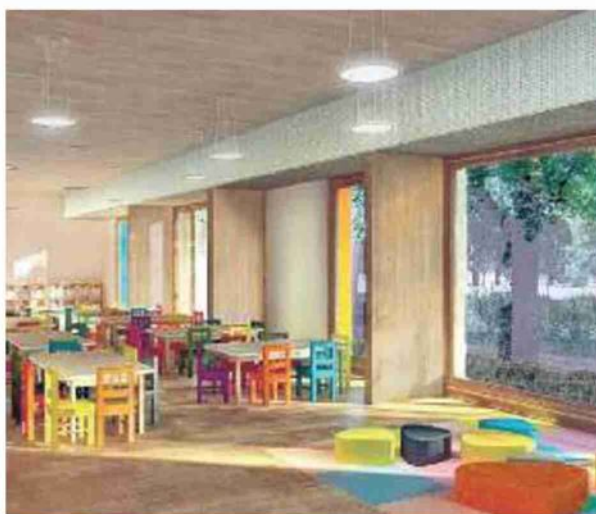
TUTTO IN LEGNO Il progetto delle aule del nido «Millecolori»